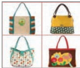
کَمْ عَدَدُ الْحَقَائِبِ؟